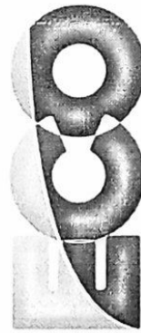
GRUPO ECO BRAZIL